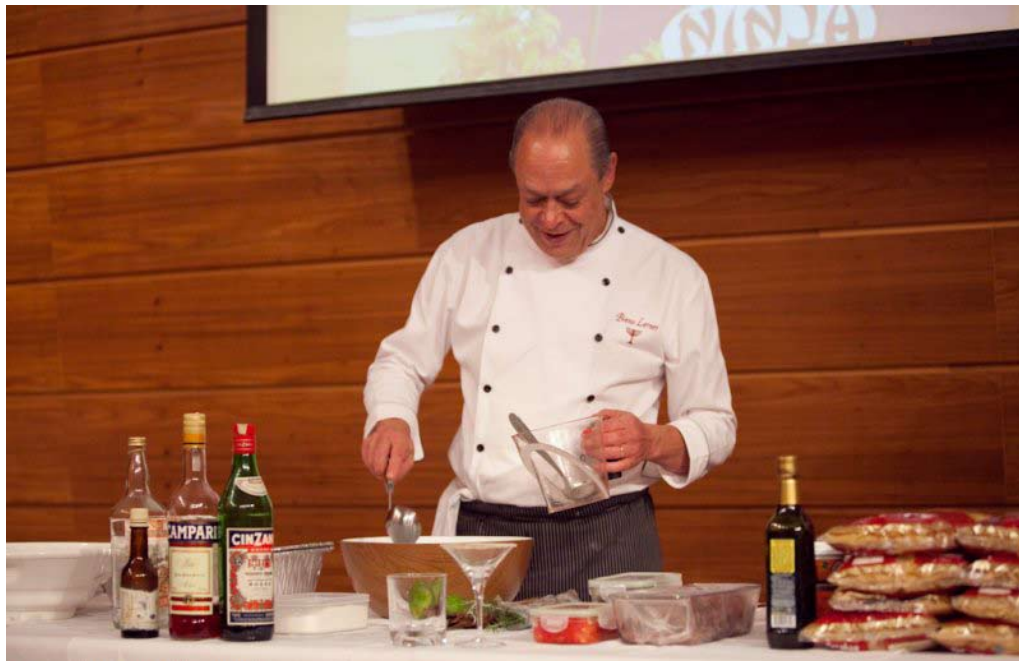
Cine Gastronomia - Virada Cultural 2009 - Receitas de Boteco

Tendo como base o posicionamento institucional do Centro da Cultura Judaica , de difundir o patrimônio cultural judaico, a cultura de paz, a coexistência e o respeito mútuo entre os povos, o projeto CULTURA & GASTRONOMIA inseri-se como uma das atividades planejadas para 2010 que envolve público diversificado. As atividades são 100% gratuitas e os workshops ministrados por amantes da cultura e da gastronomia, que transformam os encontros em verdadeiros momentos de aprendizagem, diversão e integração.